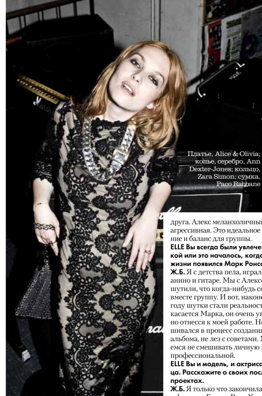
Платье, Alice & Olivia; кольцо, серебро, Ann Dexter-Jones; кольцо, Zara Simon; сумка, Paco Rabanne

друга. Алекс меланхоличный, а я более агрессивная. Это идеальное совпадение и баланс для группы.