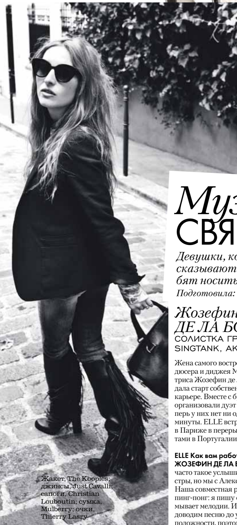
Жакет, The Kooples; джинсы, Just Cavalli; сапоги, Christian Louboutin; сумка, Mulberry; очки, Thierry Lasry