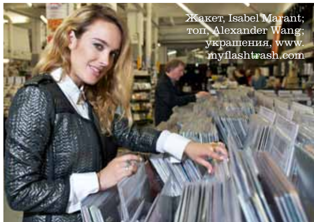
Жакет, Isabel Marant; топ, Alexander Wang; украшения, www. myflashtrash.com