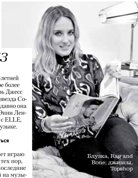
Блузка, Rag and Bone; джинсы, Topshop

Д.М. Мне нравятся сложные формы и силуэты — так, чтобы было видно с задних рядов. Недавно я выступала в простом черном платье Calvin Klein, а мой стилист пришла к нему бахрому — выглядело сногшибательно! Но мой самый любимый наряд — платье-кафтан Missoni, в нем я пела вместе с Энни Леннокс.