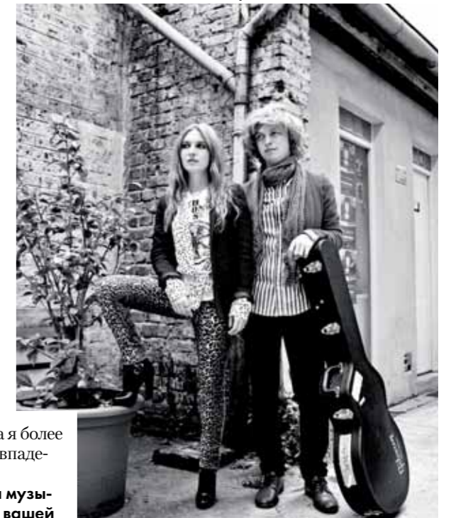
На Алексее: кардиган, Karl Lagerfeld; рубашка, Acne; шарф, John Varvatos. На Жозефине: жакет, The Kooples; рубашка, Acne; футболка, The Stone Roses; джинсы, Trash and Vaudeville; ботинки, Christian Louboutin

Ж.Б. Для SINGTANK мода — инструмент, который так же, как и музыка, доносит наши идеи. Правда, наряжа-